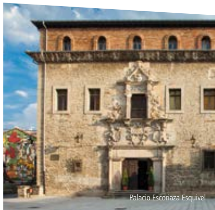
Palacio Escoriaza Esquivel

Ahora Centro Cultural Montehermoso , es un espacio de exhibición y difusión de arte y pensamiento contemporáneo. Está conectado de forma subterránea con el antiguo Depósito de Aguas de la ciudad (1885) transformado en un singular espacio expositivo.