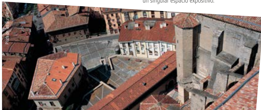
Plaza de las Burullerías