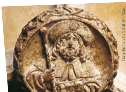
Clave Pórtico Catedral Sta. María

Al final de la ruta llegamos a la basílica románica de San Prudencio, en Armentia. Construida en el s. XII, y reformada en el s. XVIII, era el centro espiritual de Álava durante la Edad Media.