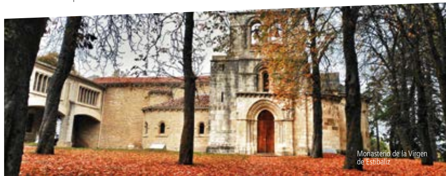
Monasterio de la Virgen de Estibalz